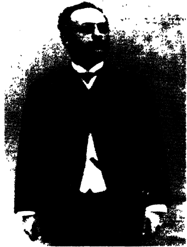
हर्मन आईस्टीन (अलबर्ट आईस्टीन के पिता)

बालक (आईस्टीन) को बचपन से ही आत्मनिर्भरता का प्रशिक्षण दिया गया। उस तीन-चार साल के बच्चे को म्युनिख की सबसे अधिक भीड़ वाली गलियों में भेज दिया जाता था। पहली बार उसे रास्ता दिखाया जाता था। दूसरी बार बिना कुछ कहे ही उस पर निगरानी रखी जाती थी। चौराहों पर वह पहले दाएं देखता था, फिर बाएं, और उसके बाद निश्चिंत भाव से सड़क पार करता था। आत्मनिर्भरता उनके चरित्र का अंग बन चुकी थी, जिसका मुखर प्रकटीकरण उनके बाद के जीवन में अनेक अवसरों पर हुआ।” उल्लेखनीय है कि आईस्टीन की बहन माजा विटलर आईस्टीन द्वारा लिखा गया अलबर्ट आईस्टीन का जीवन-चरित्र उनके परिवार और प्रारंभिक जीवन-संबंधी जानकारियों का प्रमुख स्रोत है।